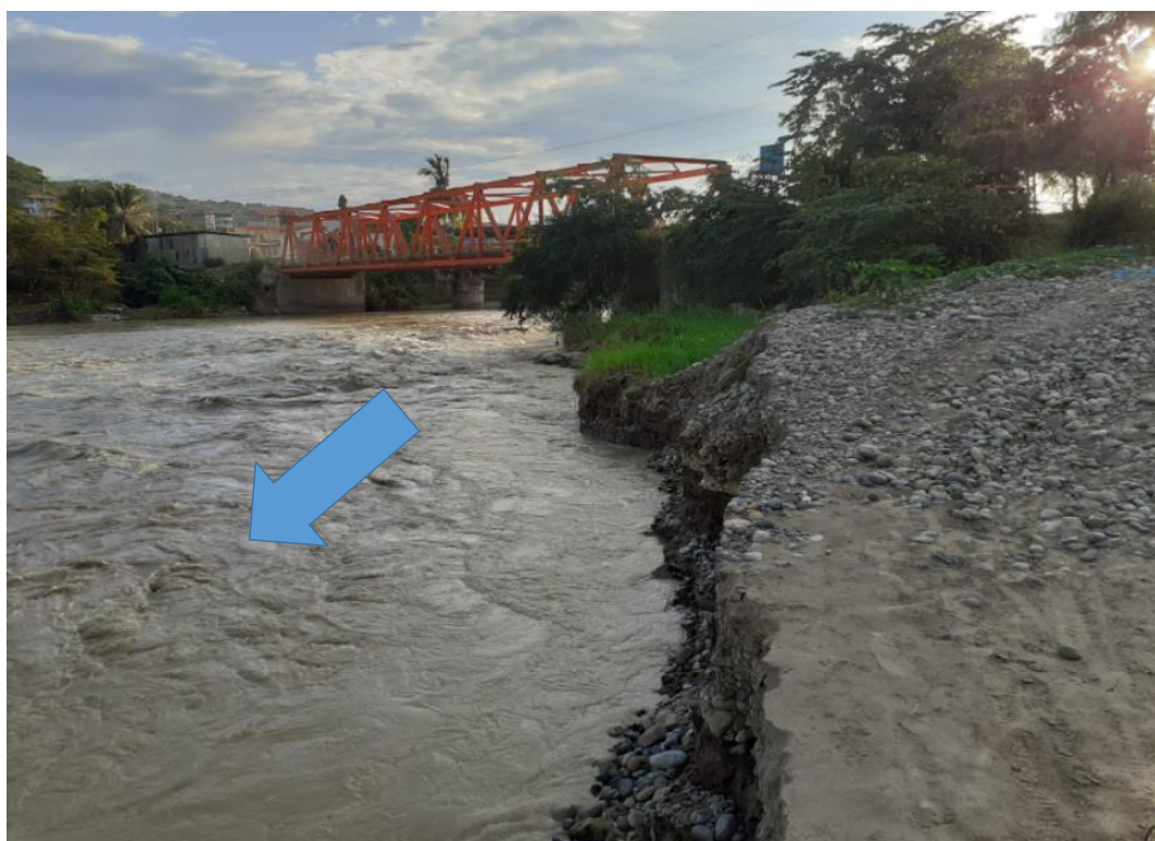
FIGURA N°02: TRAMO CRÍTICO EN EL CAUCE DEL RIO UTCUBAMBA, EN EL PUENTE NARANJITOS PRESENTANDO EROSION EN MARGEN IZQUIERDA DEL RIO EN EL SECTOR NARANJITOS, DISTRITO DE JAMALCA, PROVINCIA UTCUBAMBA - AMAZONAS