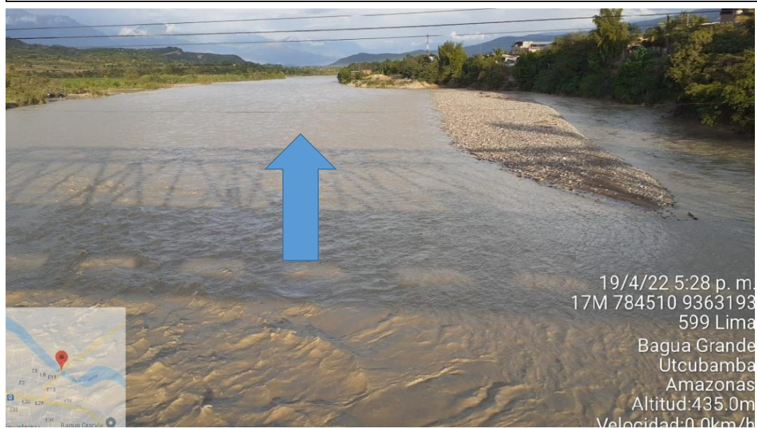
FIGURA N°01: TRAMO CRÍTICO EN EL CAUCE DEL RIO UTCUBAMBA, EN EL PUENTE NARANJITOS PRESENTANDO EROSION EN MARGEN IZQUIERDA DEL RIO EN EL SECTOR NARANJITOS, DISTRITO DE JAMALCA, PROVINCIA UTCUBAMBA - AMAZONAS